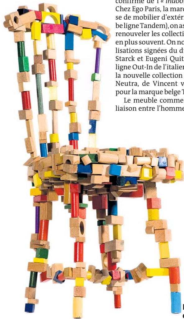
La Brick Chair du studio de création Pepe Heykoop.