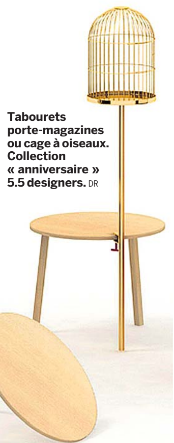
Tabourets porte-magazines ou cage à oiseaux. Collection « anniversaire » 5.5 designers. DR